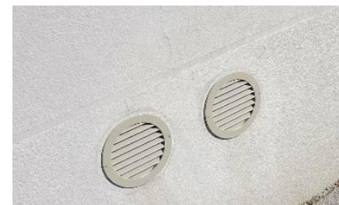
↑ Exemple de bouches d'aération d'un climatiseur intérieur