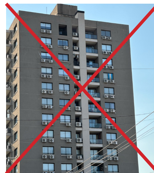
↑ L'installation d'un bloc de climatisation en façade d'un immeuble doit être intégrée à la construction sans émergence en façade.

→ Sous réserve du respect du décret n°2010-349 du 31 mars 2010 et de l'arrêté du 16 avril 2010 relatifs à l'inspection des systèmes de climatisation et des pompes à chaleur réversibles dont la puissance frigorifique est supérieure à 12 kW et de l'Arrêté du 24 juillet 2020 relatif à l'inspection périodique des systèmes thermodynamiques et des systèmes de ventilation combiné à un chauffage dont la puissance nominale utile est supérieure à 70 kilowatts