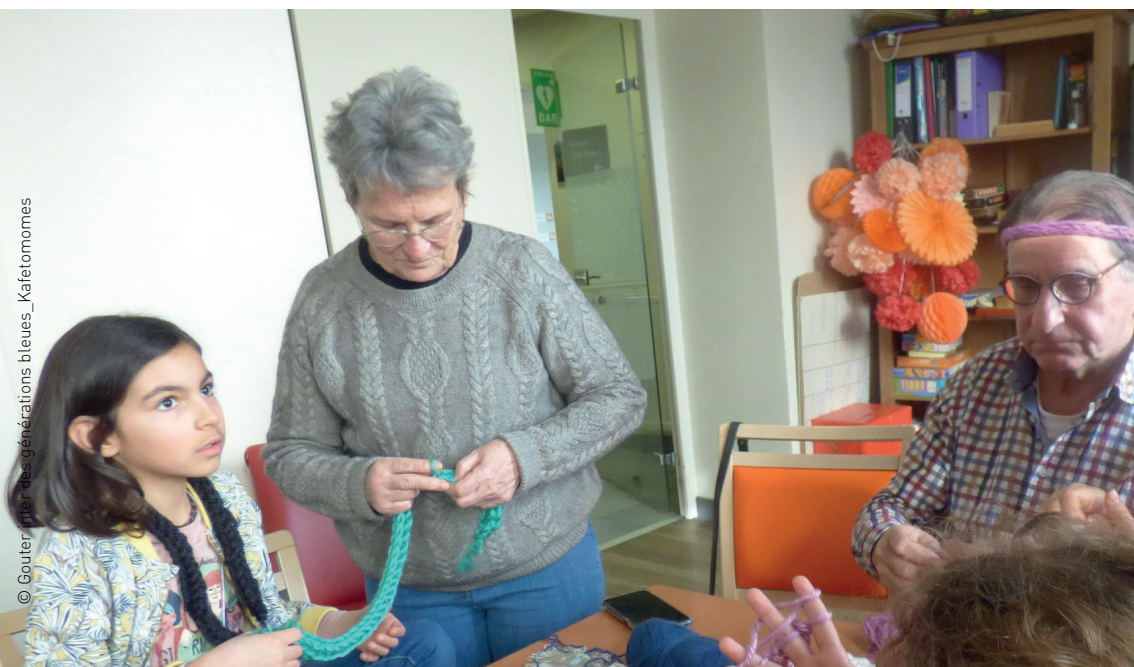
© Gouter inter des générations bleues_ Kafetomomes