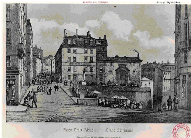
Place Croix-Paquet

Au centre de la place, au lendemain de la Révolution de 1848, des citoyens du quartier des Capucins organisèrent la plantation d'un arbre de la Liberté, sous le patronage de la « Société des Voraces », qui rassemblait les ouvriers républicains de la Croix-Rousse.