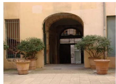
6 rue des Capucins

Il ne subsiste de cet ensemble que les premiers niveaux de la cour du 6 rue des Capucins qui furent grandement transformé au XIX e siècle et abritèrent un temps la « maison de la Banque ».