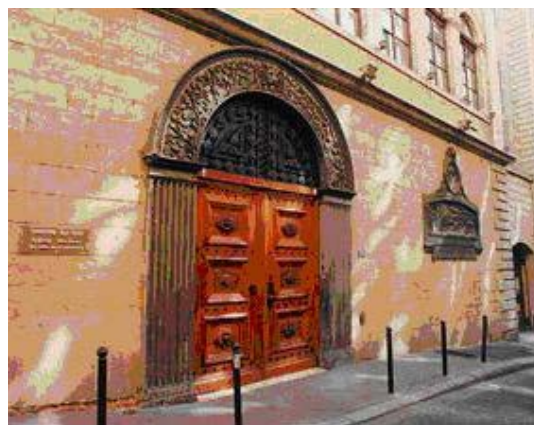
Conditions des soies, BmL

Après le départ des grossistes, le quartier a changé de physionomie.