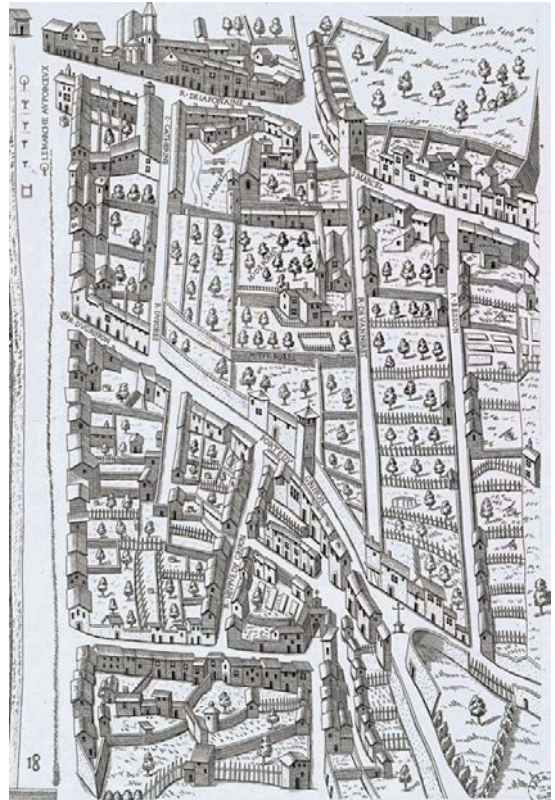
Plan scénographique de Lyon (extrait) : quartier des Capucins vers 1550 - AML 2SAT_6